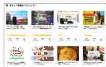
平均的に100~300万円程度の資金調達ができる