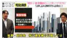
他事務所に先駆け、3月初旬から動画をアップしている

資金繰り支援について解説した動画をYouTubeで順次アップしています。合わせて、「事業計画×コロナ融資×雇用調整助成金」をセットにした支援サービスも開始。今後は、固定費である税務顧問料を減らしたいというニーズが出てくるはず。6月には、クラウド会計をベースに、仕組み化・標準化を徹底的に進めた、高品質で安価な顧問サービスをリリース予定です。